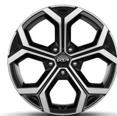
Jante din aliaj de 18"

*Imaginile afișate au caracter ilustrativ. Culoarele pot varia în funcție de culorile monitorului și pot apărea diferite în comparație cu produsul real.