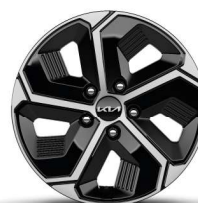
Jante din aliaj de 16"